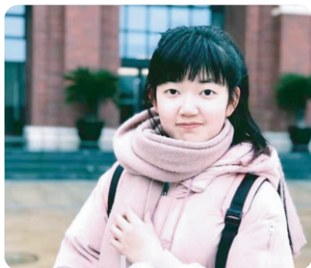
专业: 英语 毕业年份: 2021年 考取学校: 上海外国语大学