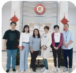
安路集团人力资源部赴商学院 共同商谈学生实践基地建设