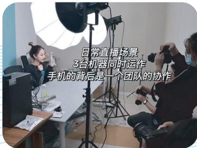
工商管理系学生创业—直播带货