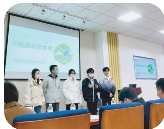
工商管理系学生参加创新创业比赛